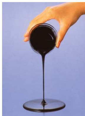
Coal Water Mixture (CWM)

高濃度CWMの製造は、石炭をCWMに適した粒度分布に粉砕し、適な添加剤(分散剤と安定剤)を選定し、石炭・水・添加剤を適切に混合することにより、高濃度・低粘性・高安定性で良質のCWMを製造することが可能となる。CWM製造プロセスのブロックフローを図-1に示す。